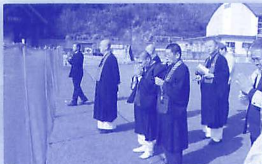
伊里前小学校の校庭